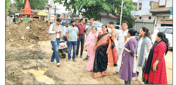
हरिभूमि न्यूज | नर्मदापुरम

राज्य सभा सांसद ने गुणवत्ता पर जताई नाराजगी