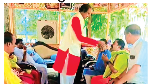
हरिभूमि न्यूज | नर्मदापुरम