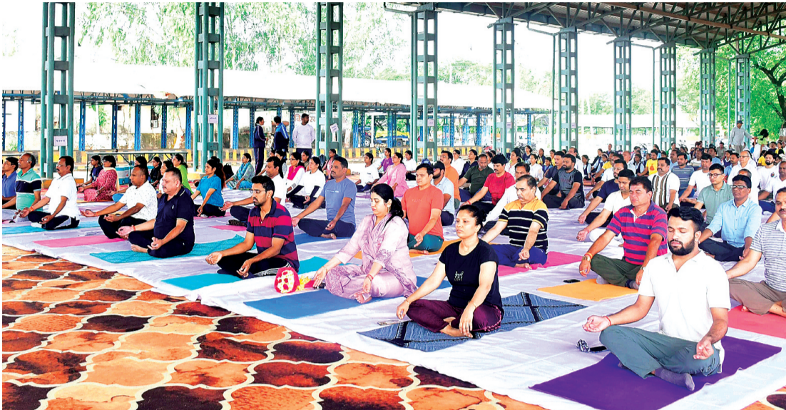
हरिभूमि न्यूज | हरदा