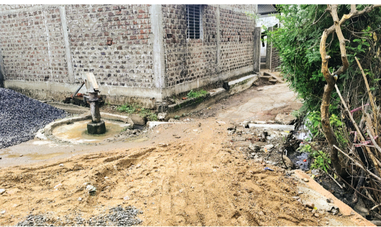
कोई विकास कार्य नहीं हो रहा है।